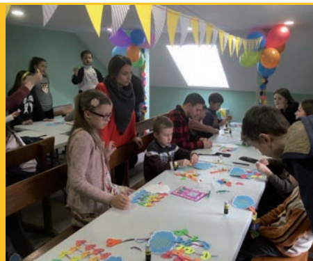
I bambini dell'Arca della Misericordia